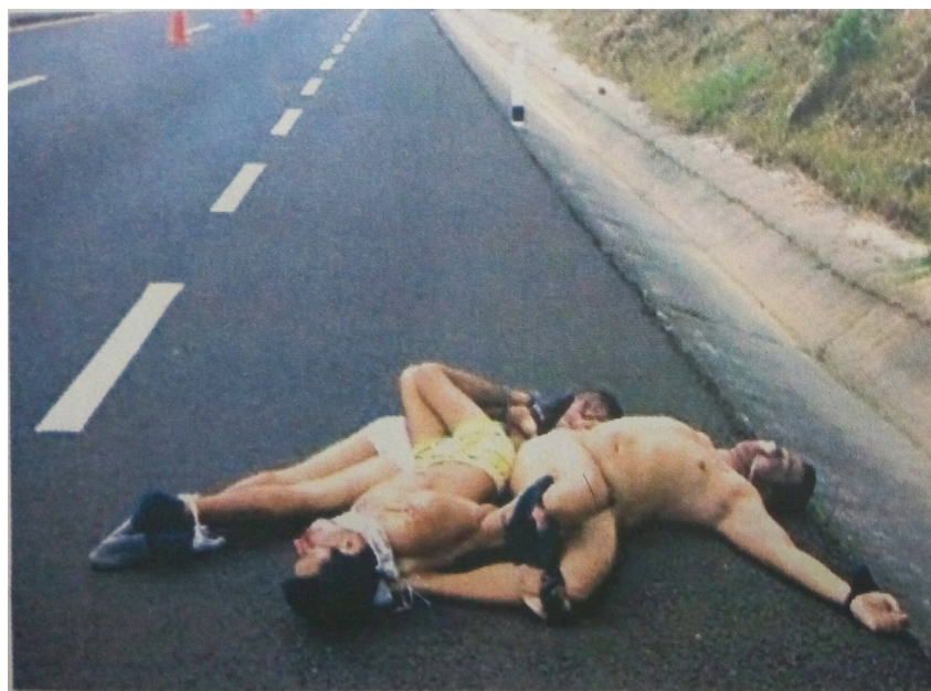
Figura 2. Encuentran 3 ejecutados en la Xalapa-Perote