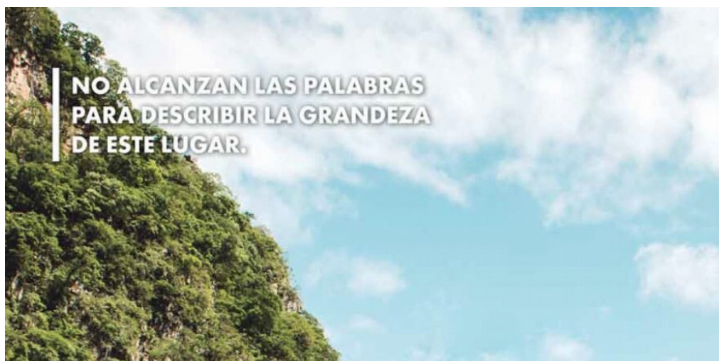
Figura 4. En Veracruz: la mejor atención nacional en el tema de desaparecidos

En el nivel del studium , en la figura 4 se observa un paisaje capturado con un pla-