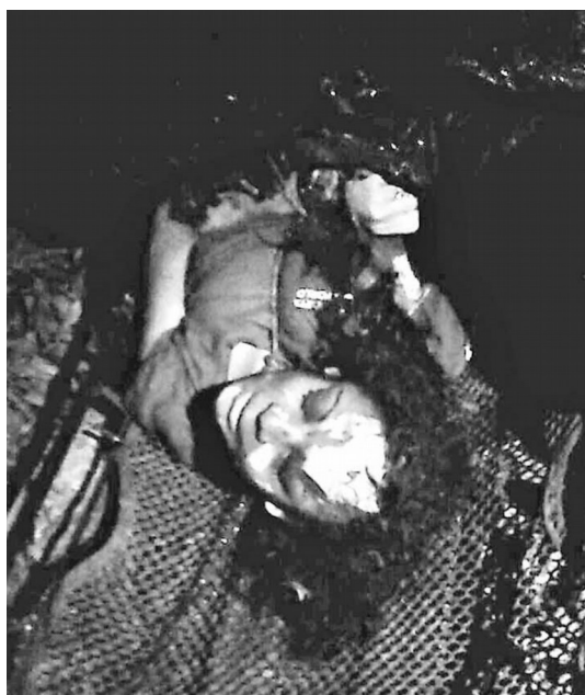
Figura 1. Investigan hallazgo de joven embolsada en el río Cotaxtla

En ese orden: por, mujer y joven. Son las palabras más recurrentes en las notas relacionadas con el tema de feminicidio en el corpus que aquí se analiza. Como si se tratara de una respuesta que reitera una constante: el rostro joven del feminicidio. La figura 1 sintetiza varias de las características encontradas en otras fotografías de la serie sobre feminicidios. En el nivel del studium se trata del cuerpo no identificado de una mujer que fue arrojada al río en una bolsa plástica, encontrada con evidentes huellas de tortura y las manos atadas. La foto es tomada con la mujer de cabeza, inclinada ligeramente hacia la derecha para quien observa. Tiene las manos atadas y las extremidades inferiores están dentro de la bolsa negra. Aparece en un plano en picada que tiene el efecto de mostrar la figura fotografiada como disminuida, transmitiendo la sensación