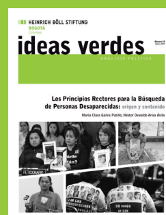
Número 19 Agosto 2019