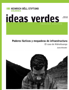
Número 13 Diciembre 2018