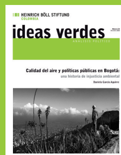
Número 14 Diciembre 2018