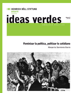
Número 17 Abril 2019