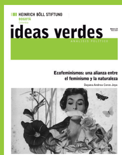
Número 15 Marzo 2019