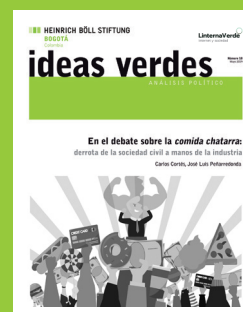
Número 18 Mayo 2019

Fundación Heinrich Böll Oficina Bogotá - Colombia