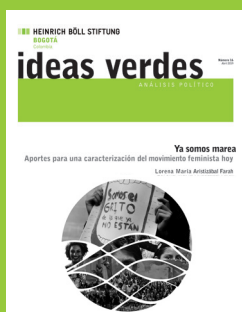
Número 16 Abril 2019