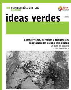
Número 11 Octubre 2018