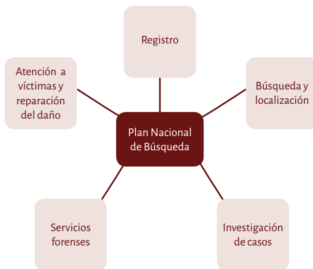
Esquema 4. Áreas de política pública en materia de desapariciones forzadas e involuntarias

En el ONC estamos conscientes de la necesidad y urgencia de impulsar la creación de políticas públicas de seguridad y justicia que permitan la pronta localización de las personas desaparecidas, identifiquen las causas estructurales y contextos específicos de las desapariciones, prevengan su incidencia, garanticen el acceso a la verdad y la justicia, reparen el daño, entre otros objetivos. Bajo esta perspectiva, es necesario contar con diversas áreas de política en las que las instituciones deben trabajar con un enfoque de coordinación permanente y de rendición de cuentas. En el Esquema 4 se presentan las áreas de política en esta materia.