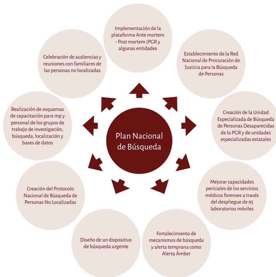
Esquema 3. Plan Nacional de Búsqueda