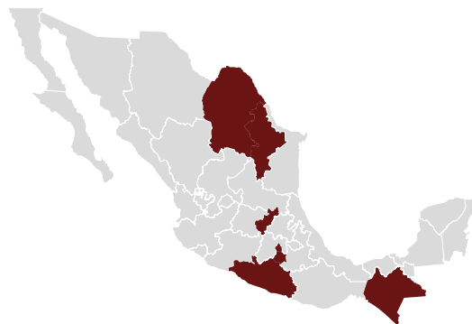
Mapa 1. Entidades federativas que cuentan con una ley específica en materia de desapariciones forzadas

Una de las primeras aproximaciones para identificar las características de dicha respuesta estatal consiste en ubicar si normativamente cuentan con lo necesario para atender lo que requieren las víctimas directas e indirectas de estos delitos. Desde esta perspectiva, si se revisa la legislación estatal encontramos que siete entidades federativas cuentan con una ley específica en materia de desapariciones forzadas, que son: Chiapas, Ciudad de México, Coahuila, Guerrero, Morelos, Nuevo León y Querétaro. Uno de los rasgos sobresalientes de estas leyes es que la mayoría de ellas fueron publicadas entre 2014 y 2015, es decir, varios años después de que se comenzara a presentar el nuevo patrón de desapariciones. Guerrero es la única entidad federativa que cuenta con la ley correspondientes desde 2005. Otro caso que es importante destacar es el de la Ciudad de México, puesto que esta entidad no solo contaba con una ley previa para el Distrito Federal a la publicación de la Ley General en Materia de Desaparición Forzada de Personas, Desaparición Cometida por Particulares y del Sistema Nacional de Búsqueda de Personas , sino que en noviembre de 2017 publicó una nueva ley con obligaciones adicionales para las autoridades estatales en cuanto a la reparación del daño.