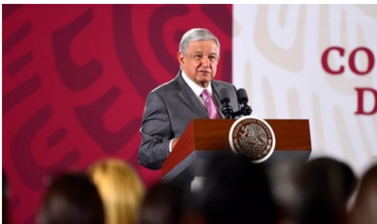
Presidente Andrés Manuel López Obrador

No nos vamos a quedar callados, se debe dar credibilidad a las instituciones; hacer investigación de fondo