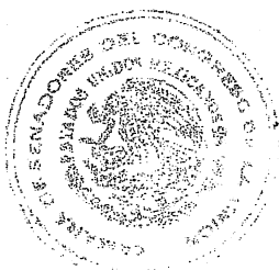
SEN. JOSÉ ROSAS AISPURO TORRES Vicepresidente